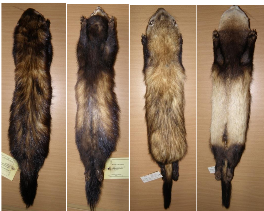
Obr. 3 Kožní preparáty tchoře tmavého a tchoře stepního (Naturhistorisches muzeum ve Vídni). Zleva: tchoř tmavý shora, tchoř tmavý zdola, tchoř stepní shora, tchoř stepní zdola.