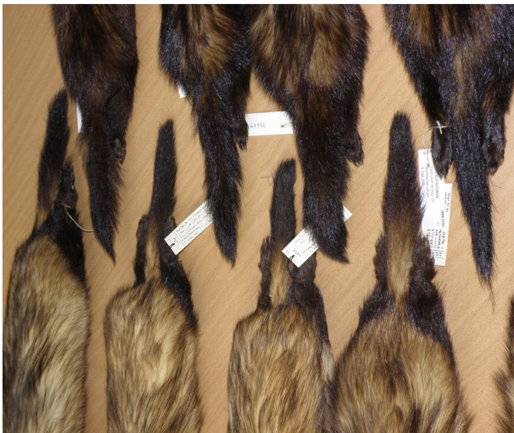
Obr. 4. Detail zbarvení kořene ocasu u tchoře tmavého (horní část obrázku) a u tchoře stepního (spodní část obrázku) (Naturhistorisches muzeum ve Vídni, foto: L. Poledník)