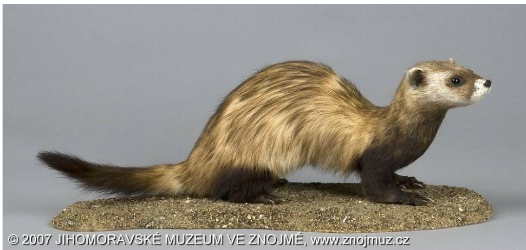
Dermoplastický preparát tchoře stepního v jihomoravském muzeu ve Znojmě.